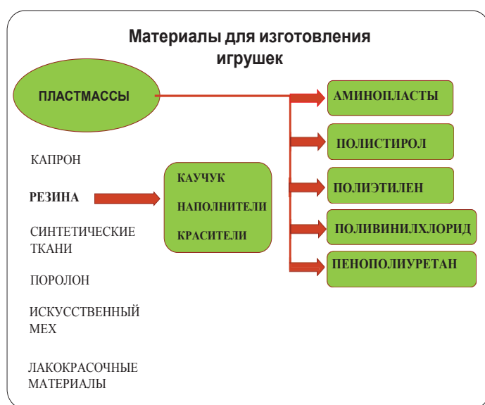
Рис. 1. Материалы для изготовления игрушек

Деревянные игрушки экологичны, безвредны, подходят для детей всех возрастов. Однако следует иметь в виду, что для обработки поверхностей этих игрушек используют разнообразные лакокрасочные материалы, (масла, эмали, нитрокраски), в том числе материалы для лакировки и полировки деревянных изделий. Также крепежными деталями в таких игрушках могут служить изделия из металла. Следовательно, безопасность деревянных игрушек также должна строго контролироваться.