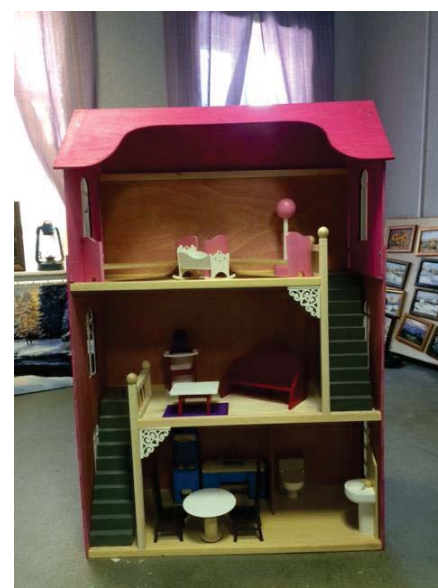
Рис.2. Образец для испытания

Правовое регулирование обращения игрушек в Таможенном союзе обеспечивается действующим